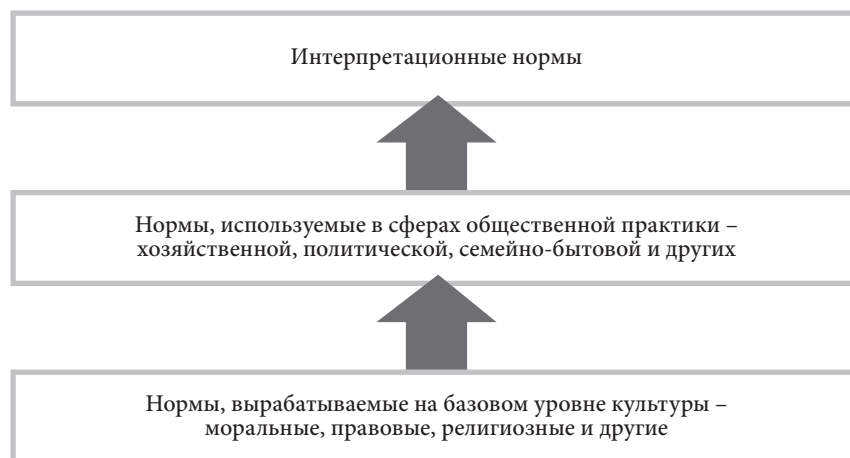
Рисунок 1. Модель соционормативного регулирования культуры

В механизме самоорганизации общества, кроме неперсонифицированных, используются и другие регуляторы, в частности директивные, предполагающие наличие конкретных субъектов, отдающих распоряжения исполнителям. В отличие от директивных регуляторов, ставящих в жесткие рамки поведение индивидов, социокультурные нормативные регуляторы обеспечивают индивидам свободу волеизъявления, возможность сознательного выбора линии поведения, соответствующей нормативным требованиям. За рамками сво-