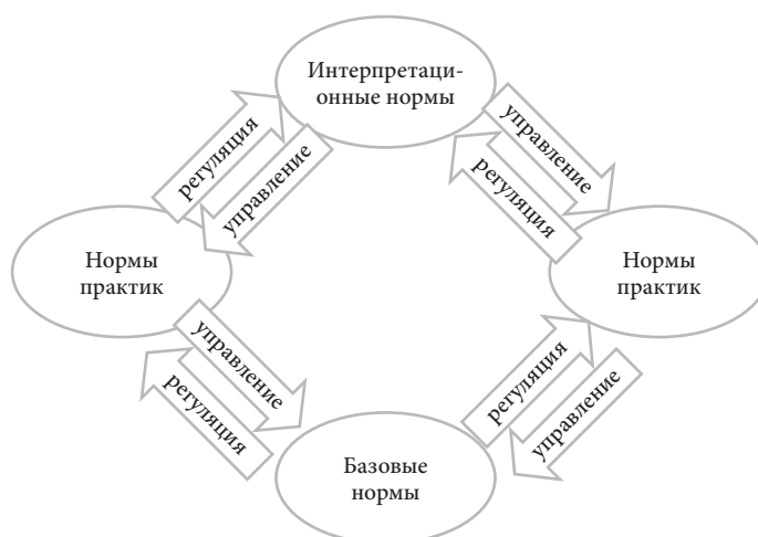
Рисунок 3. Схема цикла регулятивно-директивного управления правовой культурой в политической коммуникации

муникации. Скорости и объемы движения информации обуславливают необходимость циклических схем [10, 14, 16, 17, 19]. В частности, отображение цикла соционормативного регулирования культуры с учетом места в нем директивного управления позволяет наглядно представить инверсию регулятивных норм (стрелка «регуляция») в директивы (стрелка «управление») рационального управления на уровне их интерпретации, а также превращение рациональной директивы в нормы регулирования и самоорганизации общества на базовом уровне культуры (см. Рисунок 3).