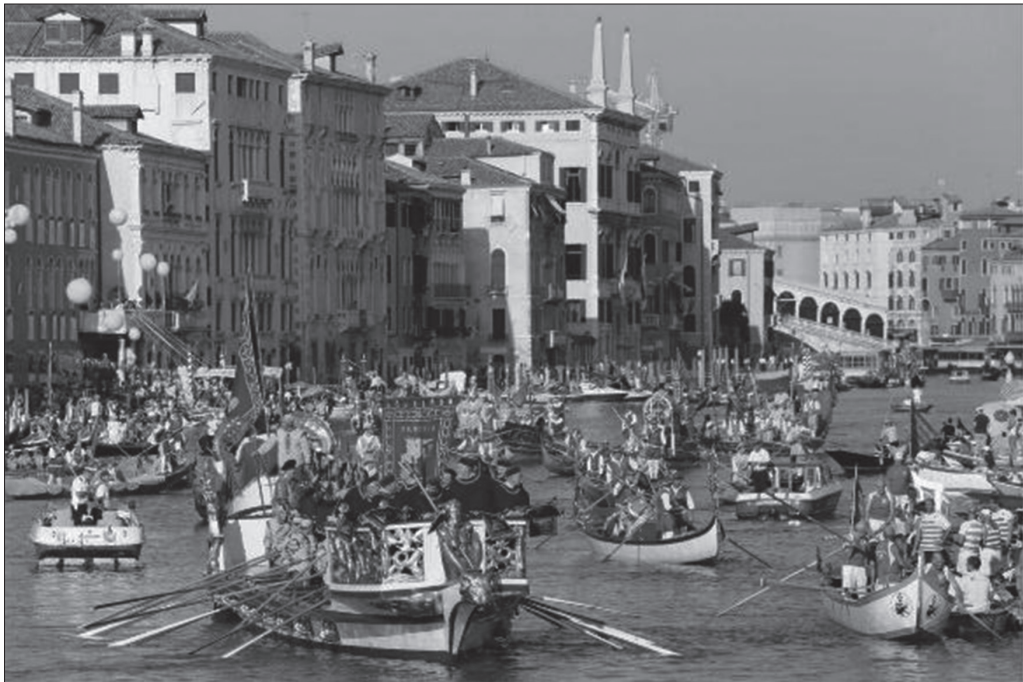
Рис. 2. Историческая регата Венеции

Около 1274 года появляется письменное свидетельство о проведении заплыва с веслами, типичное для венецианской республики; потом, начиная с XIII века, Венеция проводит подобные спортивные мероприятия для демонстрации своей мощи. Власти того времени всячески поощряли проведение подобных соревнований, в которых видели возможность занять людей в мирное время полезной активностью, а также – держать в боевой