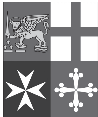
Рис. 3. Эмблема морских держав

В Венеции есть особое выражение “пойти под флагом” ( andàr in bandiera ), что значит выиграть или прийти одним из четырех призеров регаты. Это относится не только к четырем призерам регаты Венеции, но и к регате четырех морских держав.