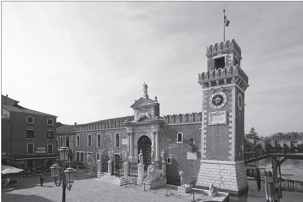
Рис. 1. Арсенал в Венеции

Значение регаты для Венеции складывается через формирование образа коллективного представления о флоте, который воплощал величие и грандиозность великой морской державы. У Венеции была самая совершенная система навигации наряду с генуэзской. Возвышение венецианского флота происходит в XIII–XV веках, когда венецианские корабли ездили по Черному морю вплоть до Северной Африки. Флот перевозил дорогостоящие грузы на судах особого типа – торговых галеех, которые строились на специальных верфях. У Венеции была особая система охраны: караван отправлялся за дорогими товарами и руководство республики объявляло аукцион. Когда принималось решение послать определенное количество галей в некий город, то каждая галea снаряжалась тем человеком, который заплатит больше за навигацию (фрахт). Этот патрон обязывался нанять экипаж и оснастить его всем необходимым, обеспечить припасами, оружием и осуществить навигацию в едином конвое, при этом капитан назначался государством, а патроны – это частные лица, которые шли по распорядку капитана, который делал план навигации. Сенат давал инструкцию, в каком порту сколько стоять, чтобы избежать корабельных налогов и опасностей: на сушу, например, не выходило иногда более одной трети экипажа. Такой флот из восьми-девяти галей (в военное время он сопровождался военными