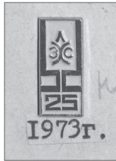
Ил. 10. Значок «25 лет ЛЗХС». 1973.