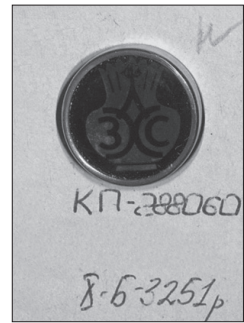
Ил. 11. Значок «ЛЗХС». 1970-е.

дарственного музея истории Санкт-Петербурга представлены сувенирные алюминиевые нагрудные значки, представляющие варианты монограммы «ЛЗХС», выпускавшиеся в 1960–1970-е годы. [4, 5].